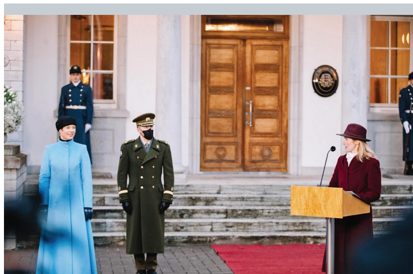
Kaja KALLAS (în dreapta) și guvernul ei investit de către Președinta Estoniei, Kersti KALJULAID (în stânga).

Cu ambiția de a opri producerea de energie din șisturi bituminoase până în anul 2035 și de